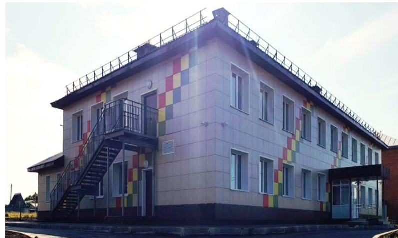
МКДОУ «Детский сад №2 п.Теплое»