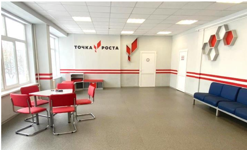
МКОУ «СОШ №2 п. Теплое им. кавалера ордена Красной Звезды К.Н. Емельянова»