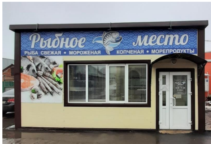
Магазин «Рыбное место»