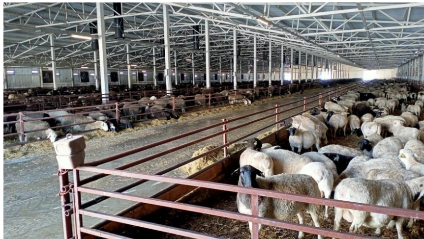
ООО «Фатежская ягнятина»