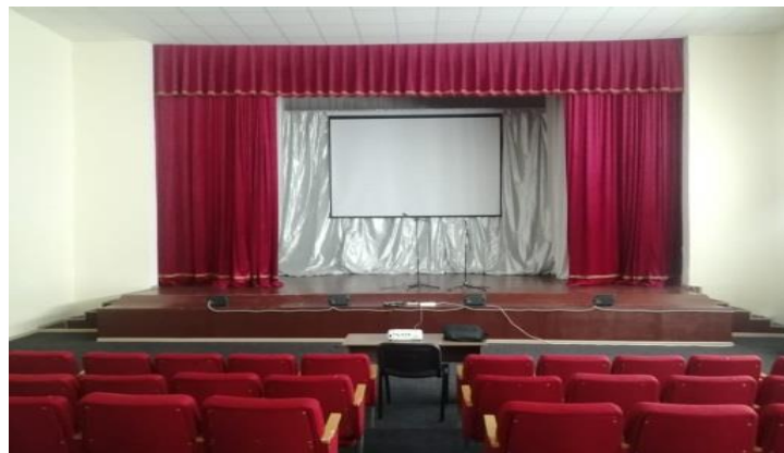
Красногвардейский сельский ДК