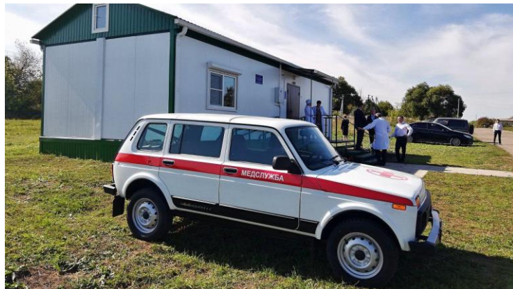
ФЗП в д. Малая Огаревка