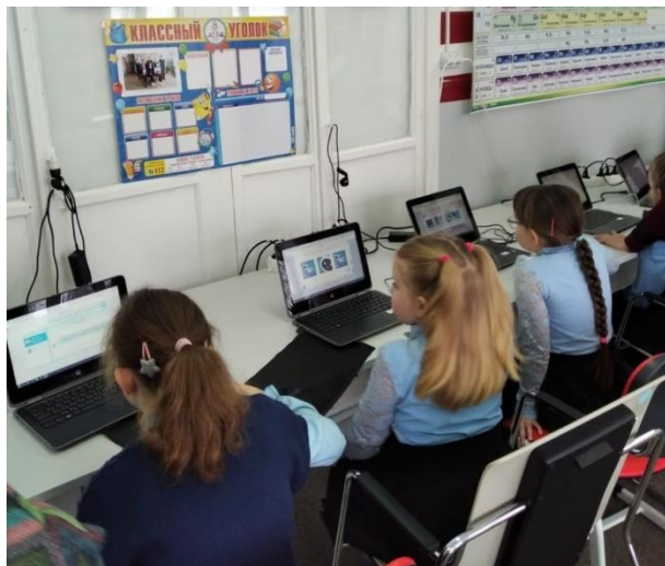
МКОУ «Алексеевская СОШ»