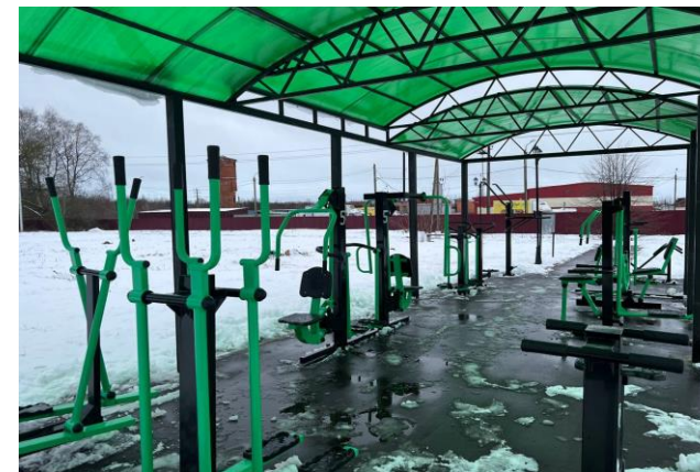
Тренажерный комплекс Парк культуры и отдыха п. Теплое