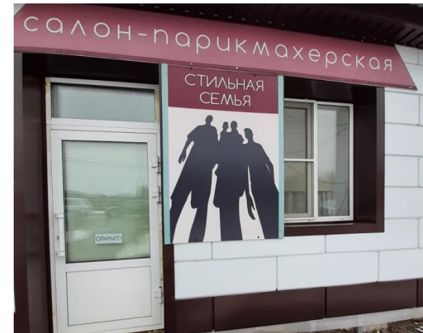
Салон-парикмахерская «Стильная семья»